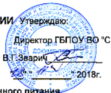
ГРАФИК проведения ПРОМЕЖУТОЧНОЙ АТТЕСТАЦИИ Утверждаю: обучающихся по ППССЗ учебной группы Гр. Тп 15 4 курса 12.01. по 13.01. 2019 года

специальность 19.02.10 Технология продукции общественного питания