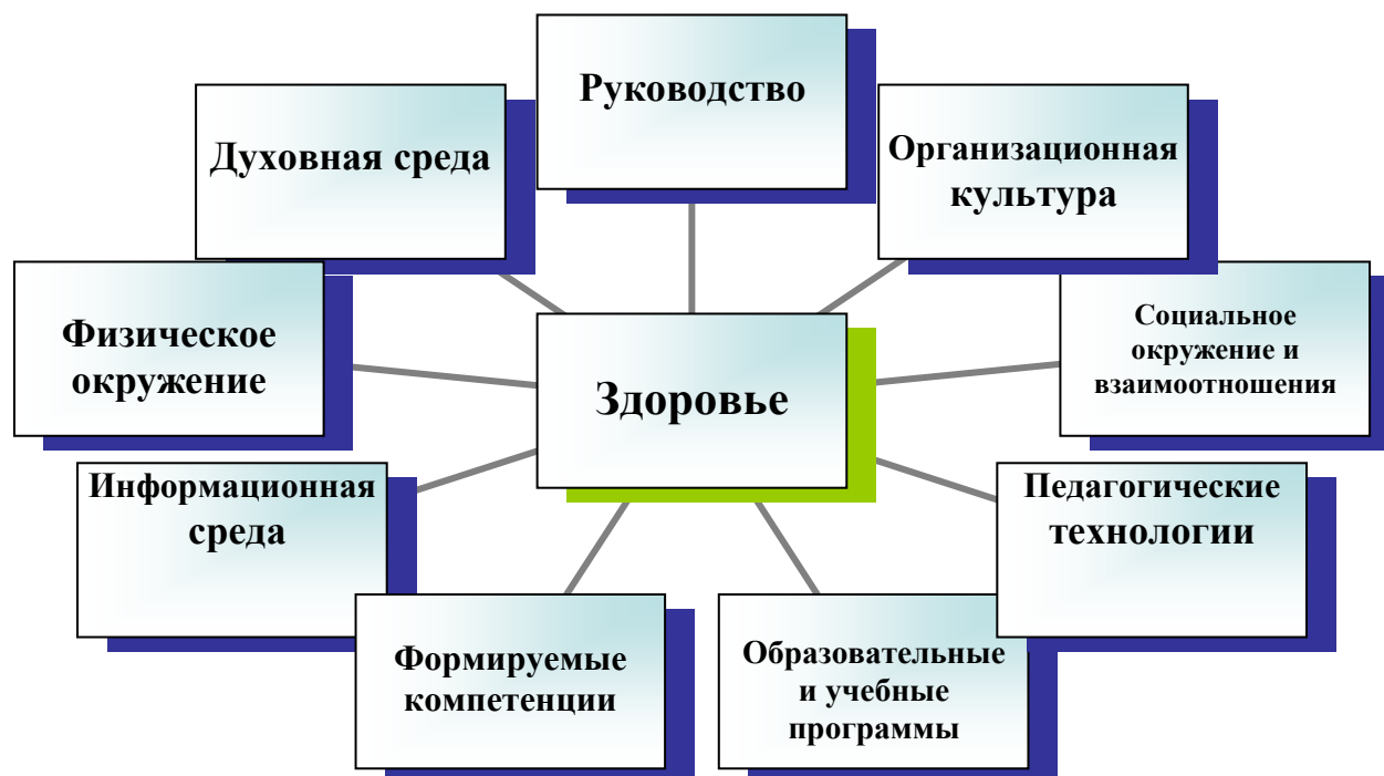
Модель здоровьесберегающей среды